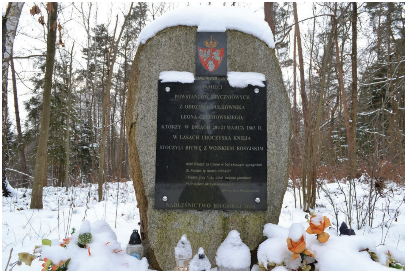
Pomnik w Ciosmach Kniei.

15 marca 1863 roku, na terytorium Królestwa Polskiego wkroczył Leon Czechowski (1797–1888), tym samym rozpoczynając swoją kampanię powstańczą, w ramach Powstania Styczniowego. Jego oddział liczył 800 piechoty i 50 konnych.